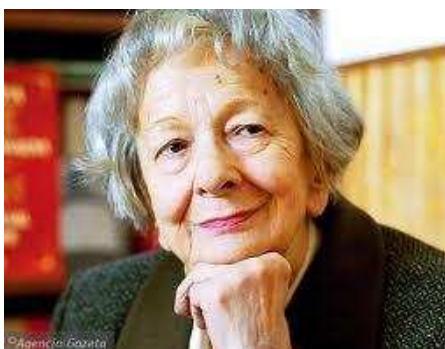
Wisława Szymborska 1923-2012